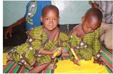
Doto & Kulwa 2 Jahre seit diesem Jahr bei MACHICA