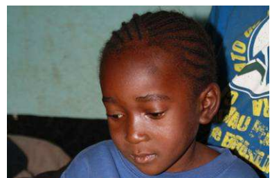
Nasma 6 Jahre seit diesem Jahr bei MACHICA