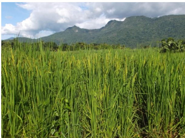
Die Reisfelder im April

Im Anschluss an den Landkauf für das MACHICA-Projekt im August letzten Jahres wurden die Rodungsarbeiten und Einsaat für die erste eigene Ernte durchgeführt. Der Regen der „kleinen Regenzeit“ kam Ende letzten Jahres spät, aber dann auch reichlich, so dass in Tansania eine gute Ernte nach dem Ende der Hauptregenzeit im Juni erwartet wird. Auf der „Shamba“ wird überwiegend Reis angebaut, der nach der ersten Regenzeit zu Beginn des Jahres eingesät werden konnte. Inzwischen sind die Sämlinge gut angewachsen, das Unkraut wurde in Handarbeit gejätet, und so machen die Flächen einen gepflegten und vitalen Eindruck.