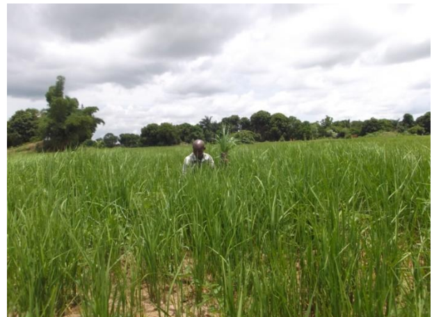
Projektleiter ‚Boni‘ prüft die Flächen